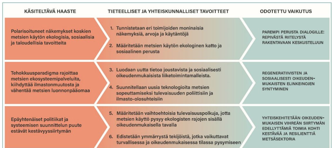
Kuva 1. Yhteiskunnalliset haasteet ja ForTran-hankkeen tavoitteet.